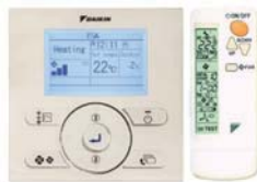
BRC1E52A BRC4C66 опционально